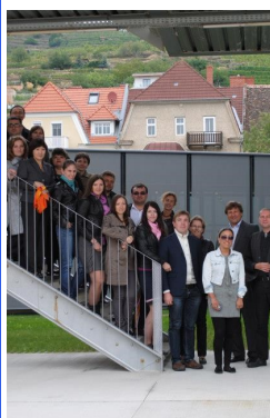
КРЕМС, группа 2012